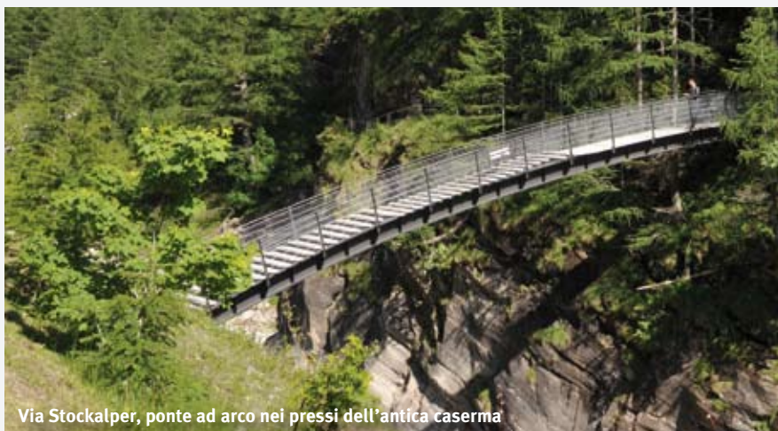
Via Stockalper, ponte ad arco nei pressi dell'antica caserma