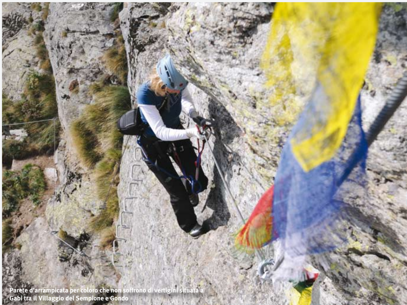
Parete d'arrampicata per coloro che non soffrono di vertigini situata a Gabi tra il Villaggio del Sempione e Gondo